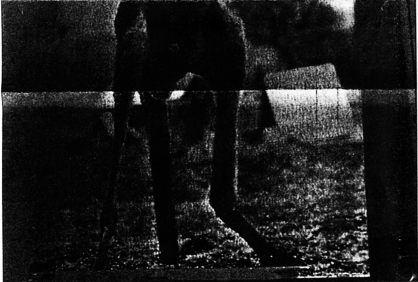
Anna Best, 'Things That Appear and Disappear: Kangaroo', 1995.